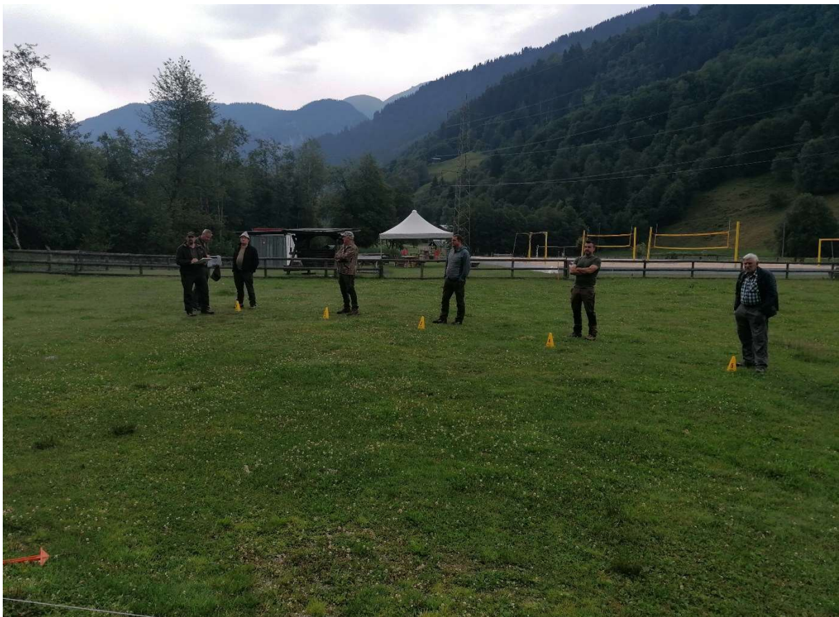
Die Hund Führer mussten am Morgen als erstes die Prüfungsgebiete und ihre Leistungsrichter per Los ziehen.