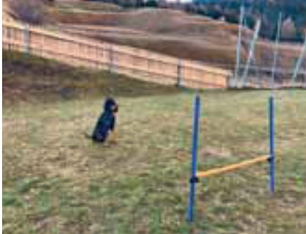
fig die Jagd sein. Ein Laufhund ist zum Beispiel ebenso für die Personensuche geeignet. Das Training dazu fordert die ganze Familie. Es wird nicht nur die Hundeführerin gebraucht, eine versteckte Person braucht es auch. Wir schlagen so zwei Fliegen mit einer Klappe. Die Nase des Hundes wird weiter gefordert und unsere Hunde wachsen so immer mehr mit der Familie zusammen und sind völlig ausgeglichen.

Es spielt dabei keine Rolle, was wir ausserhalb der Jagdzeit für Hobbys haben. Unsere Hunde sind immer gerne dabei. Wie die Bilder beweisen, macht es dem Juralaufhund sichtlich Spass mit der Tochter des Jägers die Agility-Übungen, inklusive den Gehorsamsübungen, zu machen.